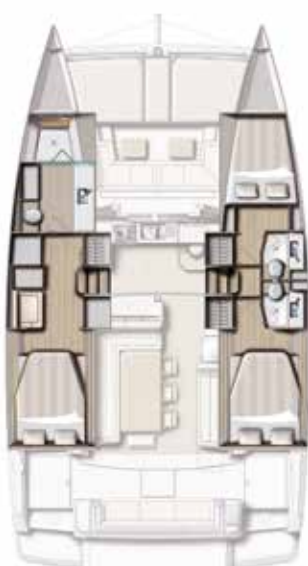
VERSION 3 CABINES / 3 SDB