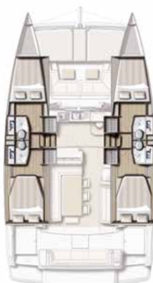
VERSION 4 CABINES / 4 SDB